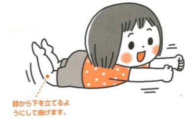
膝から下を立てるよう うにして曲げます。

・うつ伏せになり手をグーにします。 両腕、両足を伸ばし“ビューン”と言いながら床から両腕、両足を浮かせます。 目安 1.5歳～